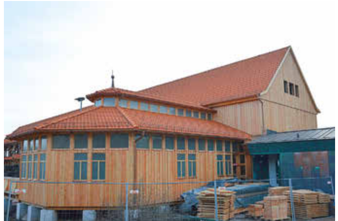
Neuer Nord-Giebel der Ostwand