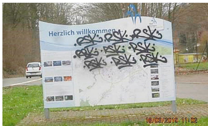
Nicht besonders einladend: illegale Graffiti in Bad Salzungen waren lange ein Ärgernis für Bürger und Verwaltung.

Der Verein „Bad Salzunger Bürger gegen illegale Graffiti e.V.“ trägt die Kosten für das Beseitigen der Graffiti, freut sich jedoch über jede Spende.