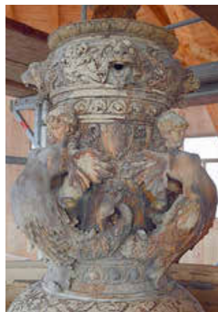
Detailaufnahme der Brunnenfiguren