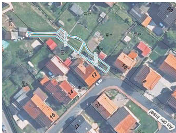
Lageplan Flurstücke Langenfeld

Bei Interesse zum Ankauf des Grundstückes reichen Sie bitte bis zum 31.03.2023 ein entsprechendes Angebot bei der Stadt Bad Salzungen ein.