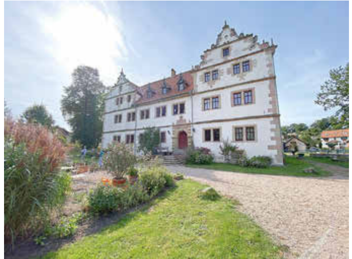
Das Schloss in Wildprechtroda ist das Herzstück des Ortes

Mit einem Jahr Corona-Verspätung wurde das Projekt zur Dorferneuerung und -entwicklung in Wildprechtroda im September 2021 offiziell abgeschlossen.