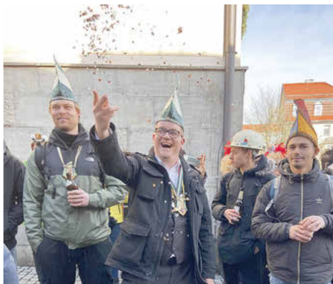
Defferte Helau! - Auch in Tiefenort wird der Karneval ganz groß geschrieben, deshalb durften die Narren auch in Bad Salzungen nicht fehlen.