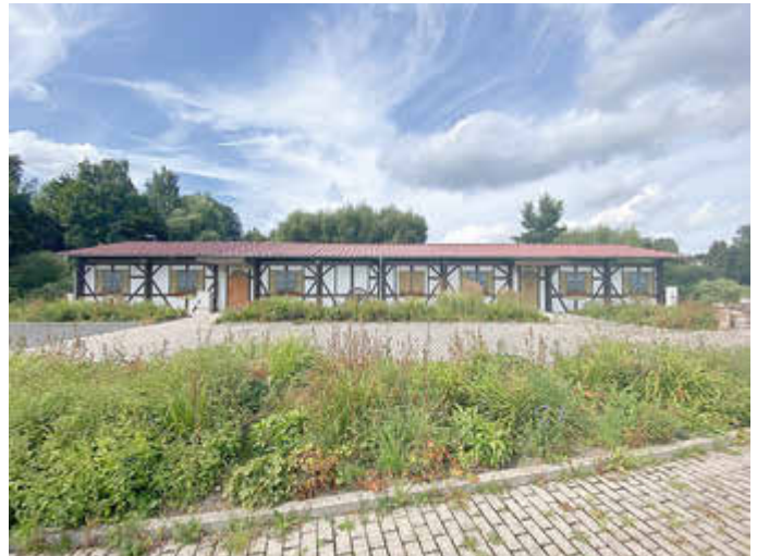
Das Dorfgemeinschaftshaus wurde im Zuge der Dorferneuerung neugestaltet