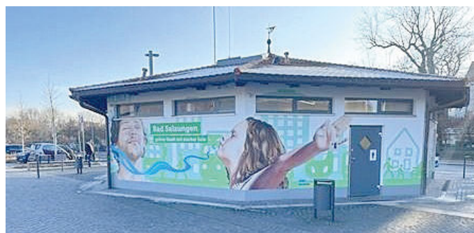
Ansprechende Gestaltung anstelle von Schmierereien: Pavillon am Bahnhof Bad Salzungen.