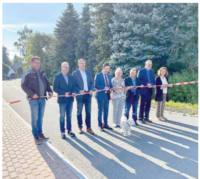
Mit der offiziellen Übergabe der Querstraße im September 2021 wurde die Dorferneuerung in Wildprechtroda abgeschlossen