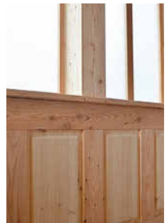
Drahtglasfenster und Kassettierung