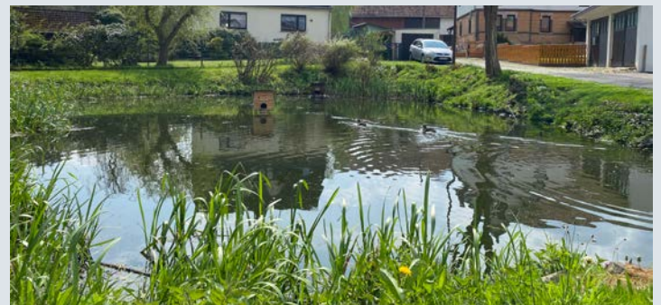
Der Dorfteich ist eine Ruheoase.