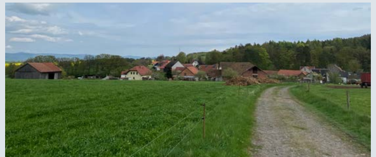
Eingebettet in Felder und Wälder.

Hohleborn bildet gemeinsam mit Langenfeld und Kaltenborn die Dorfregion MITEINANDER. Mit der Aufnahme in das Programm der Dorferneuerung hat der Ort gute Chancen, sich auch in Zukunft weiter zu entwickeln. Dazu wurde ein Gemeindliches Entwicklungskonzept (GEK) erarbeitet.