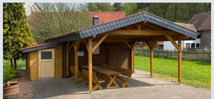
Das Dorfgemeinschaftshaus wurde 2021 erweitert.